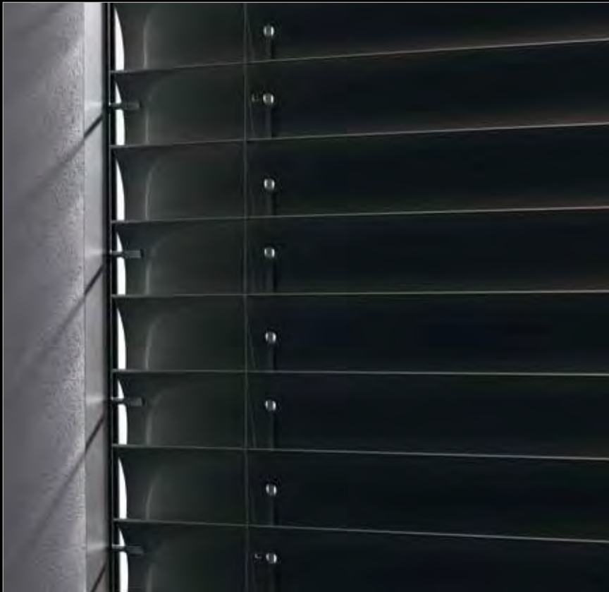
ROMA GL Raffstoren mit Lichteinfall an den Stanzungen und zwischen den Lamellen.